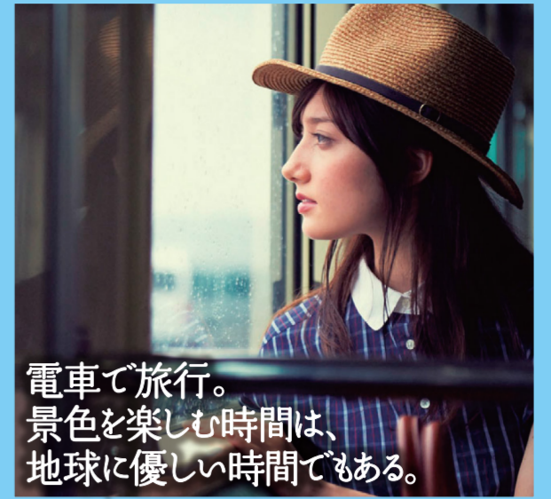
電車で旅行。景色を楽しむ時間は、地球に優しい時間でもある。