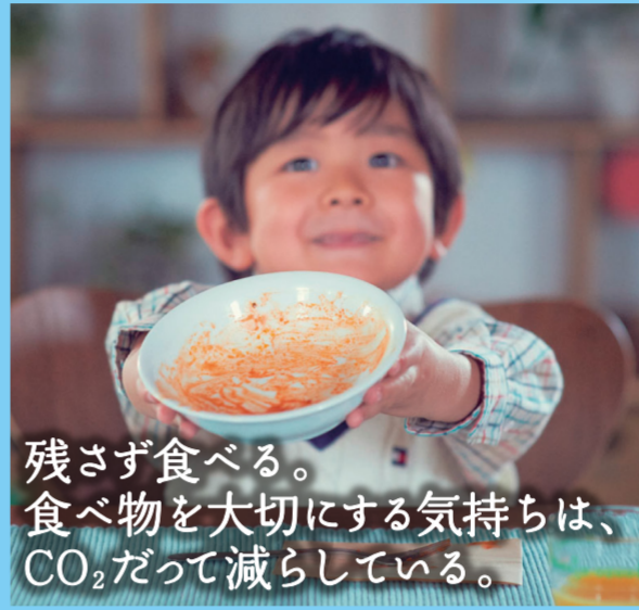
残さず食べる。食べ物を大切にする気持ちは、CO 2 だって減らしている。