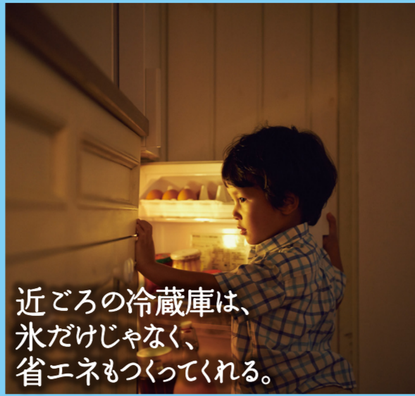
近ごろの冷蔵庫は、氷だけじゃなく、省エネもつってくれる。