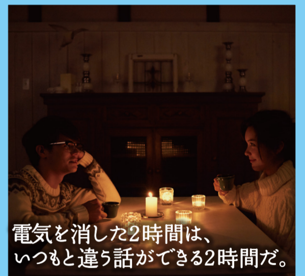
電気を消した2時間は、いつもと違う話ができる2時間だ。