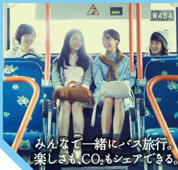
みんなで一緒にバス旅行。楽しさも、CO 2 もシェアできる。