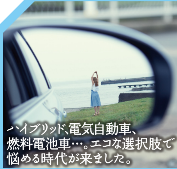
ハイブリッド、電気自動車、燃料電池車…。エコな選択肢で悩める時代が来ました。