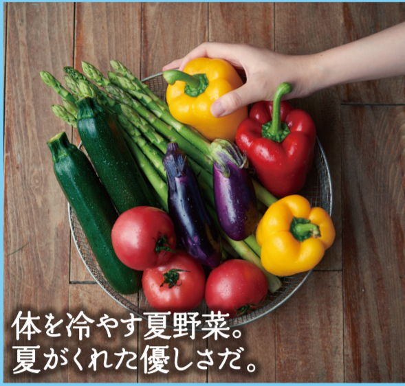
体を冷やす夏野菜。夏がくれた優しさだ。