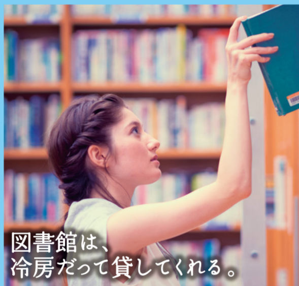
図書館は、冷房だって貸してくれる。