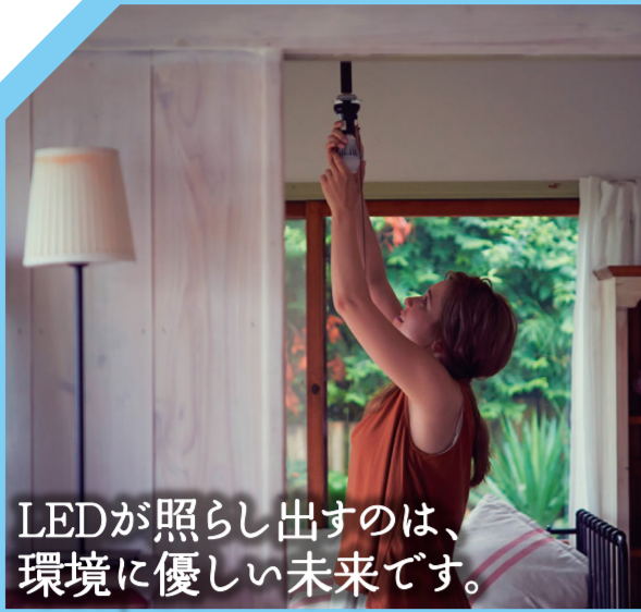
LEDが照らし出すのは、環境に優しい未来です。