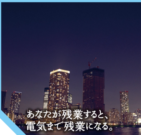
あなたが残業すると、電気まで残業になる。