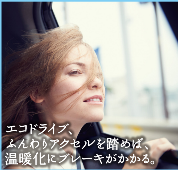
エコドライブ、ふんわりアクセルを踏めば、温暖化にブレーキがかかる。