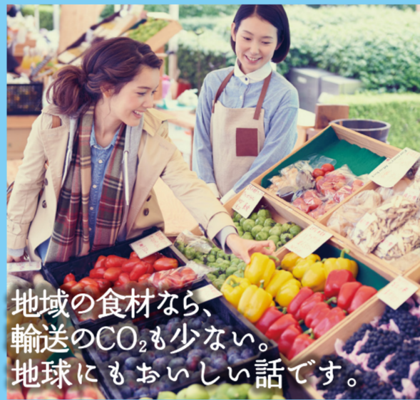
地域の食材なら、輸送のCO 2 も少ない。地球にもおいしい話です。